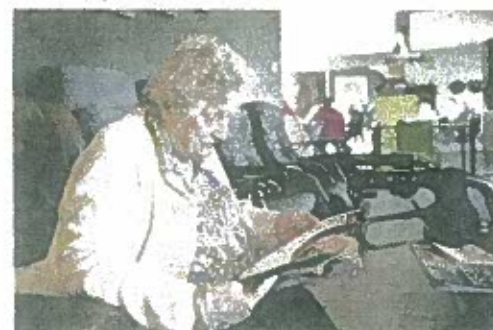
Ieder mag doen wat hij of zij graag doet.