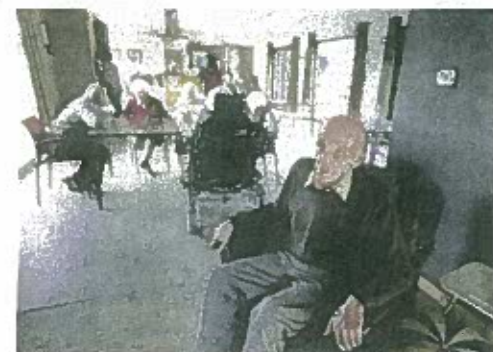
Het centrum is opgedeeld in units van acht bewoners.